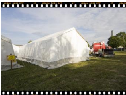
... und schon schaut das Zelt komplett aus.