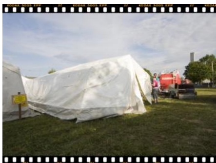
Jetzt werden noch die Füße der zweiten Seite eingesteckt....