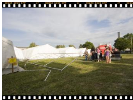
Danach werden die Füße zurechtgelegt, und dann....