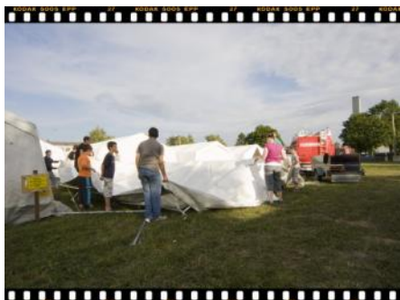
Jetzt werden die zurechtgelegten Füße in die Hand genommen....