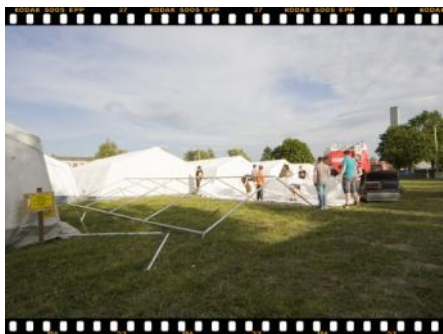
Zuerst werden die Stangen aufgelegt und die Dachstangen zusammengesteckt.

Da staunt der Laie und grübelt der Fachmann: aus einem Haufen Stangen, einer Plane und einer Menge Erdnägel entsteht nach einer raffinierten Choreographie ein Mannschaftszelt – die Feuerwehrjugend Pottenbrunn zeigt, wie´s geht.