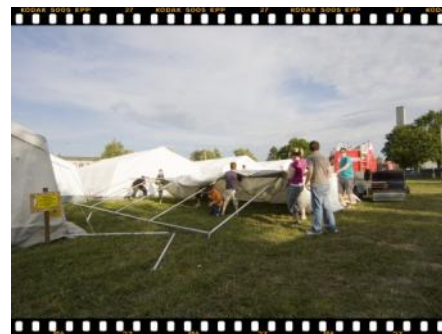
.... wird die Plane über die Dachstangen gezogen.