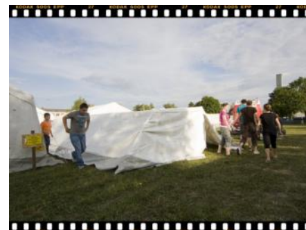
Jetzt ist das Zelt schon zu 75% fertig!