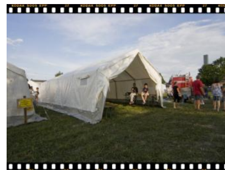
Jetzt noch alles befestigen und schon kann das Zelt bezogen werden.