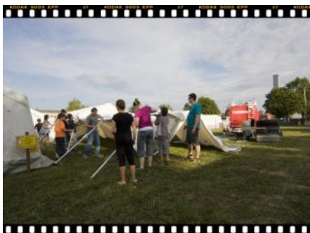
..... das Zelt gehoben und die Füße eingesteckt.